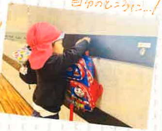
いいよ! / /おは!