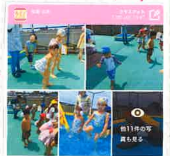
みんなの園での様子も見る