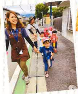
天気の良い日はお散歩にLet's go!

集団ではありますが、その子のペースで無理なく生活しています。先生であり、ママのような存在になれるよう、ご家庭と協力しながら一緒に成長を喜び、感じていきたいです。