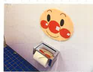
行きたくなるトイレを目指して

きっとお母さん方も心配なさっているでしょう...おトイレ問題！もちろんオムツで入園してくるお友だちもいます。その子の様子を見て園に慣れてきたら、無理なくスタート！お気に入りのトイレをはいってきてもらい、タイミングを計って連れていきます。失敗してもOK。できた時にたくさんほめてあげる事が大切です。実際、今年度もオムツだった子がトイレでできるようになりました。