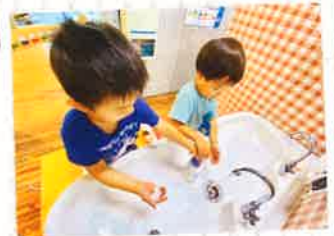
おしゃべりしたら手を洗おうね